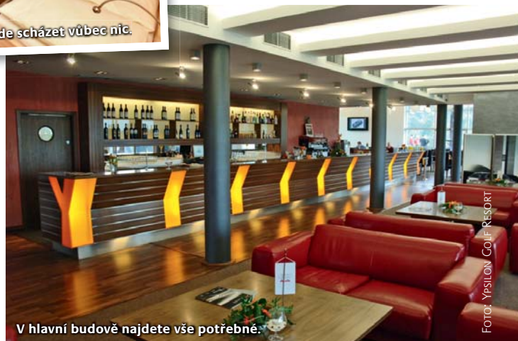
V hlavní budově najdete vše potřebné.