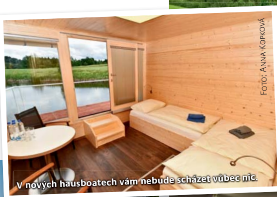
V nových hausboatech vám nebude scházet vůbec nic.

správně zvolené strategii můžete rychle čelit volbě, zda riskovat, nebo vsadit na pokoru. Nejste-li mistry v tvarování ran, pak zvlášť musíte myslet minimálně o ránu dopředu, abyste si prvním úderem připravili dobrou pozici pro následující ránu. Jinak skóre rázem nepříjemně naroste. ▶